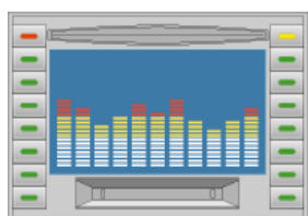
市販カーAV/カーナビ (赤外線リモコン機能付)