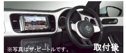
※写真はザ・ビートルです。