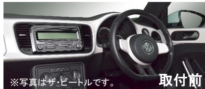
※写真はザ・ビートルです。