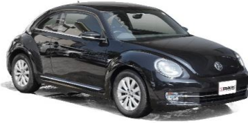
※写真はザ・ビートルです

8インチサイズの市販カーAVを取付ける為のキットです。 CAN-Busインターフェイス「GE-XA02」に対応しています。