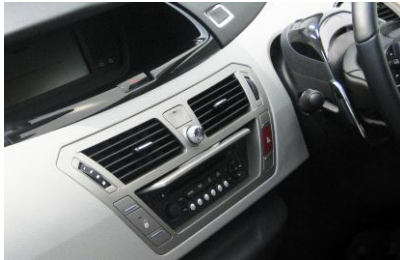
シトロエン C4 Picasso 取付後例