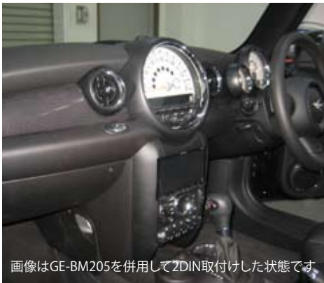
画像はGE-BM205を併用して2DIN取付けした状態です